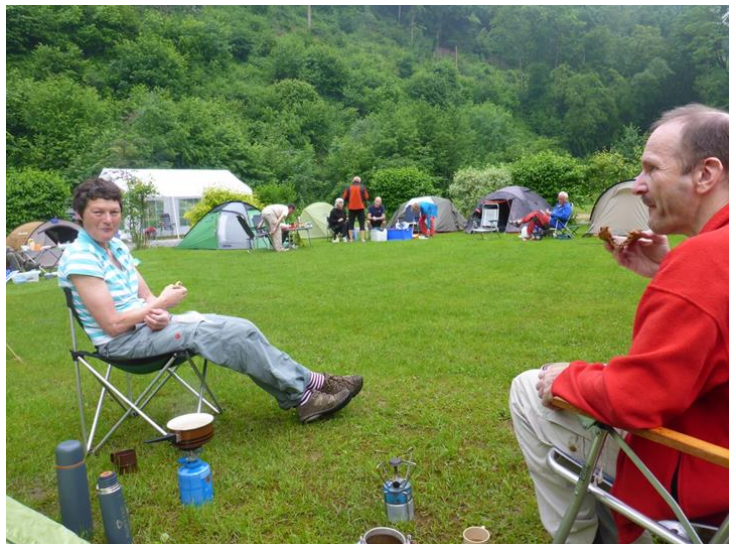
Ontbijt op de zondagmorgen