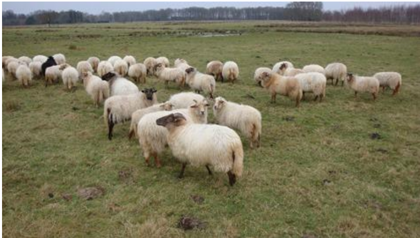
De Dwingeloosche heide