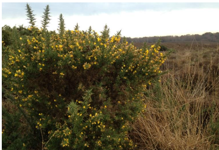
Gaspeldoorn bloeit, richting Rheden

We starten in Rheden, de poort naar de Posbank. We wandelen door de glooiende bossen van het Nationaal Park Veluwezoom. We volgen een stuk van de route van het Veluwe zwerfpad tot aan de Willemsberg. Na de lunch in de Carolinahoeve vervolgen we onze weg door bossen en heide en komen we